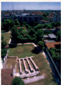
Amphitheatrum naturae: il colosseo verde di Milano