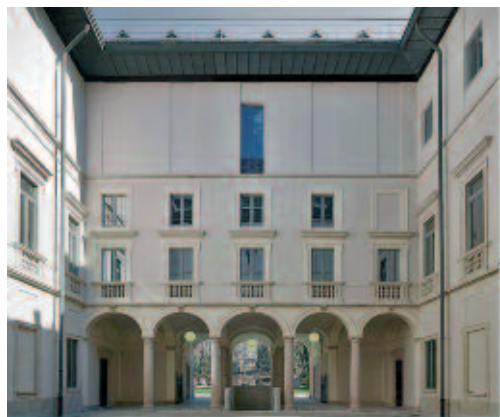
Palazzo Citterio verso la Grande Brera: Lavori 2015-2018

Realizzazione con sponsorizzazione tecnica ex art. 19 e 151 del Codice degli appalti, importo sponsorizzato € 1.250.000,00